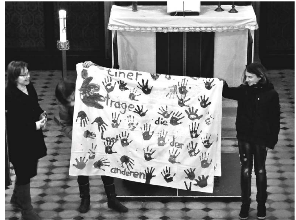
„Einer trage des anderen Last“ (Galater. 6,2): Ein von den Kindern der Christenlehre gestaltetes Tuch mit Händeabdrücken wird beim abschließenden Familiengottesdienst in der Kirche Groitzsch präsentiert.