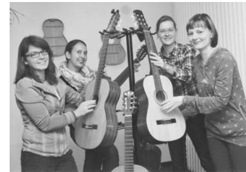
Freude an der Musik: Mitglieder des Zeitzer Gitarrenensembles