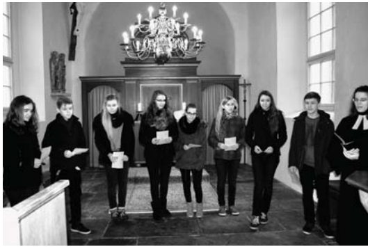
Abschlussgottesdienst der diesjährigen Konfirmandenrüstzeit in der Dorfkirche Lauenhain

Und das sind sie, unsere Konfirmanden in diesem Jahr (von links nach rechts):